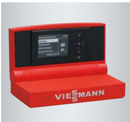
Régulation Vitotronic 200 à guidage par menu clair