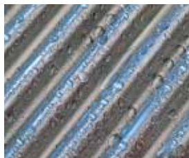
Surface d'échange Inox-Crossal en acier inoxydable